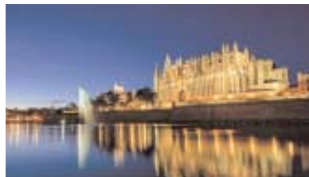
Palma by night

* si Ouest a une levée d'atout naturelle, peu importe le retour d'Est !