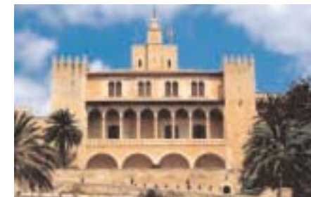
La cathédrale de Soller

à partir de 1250€ 1/2 pension 2 excursions 8 jours